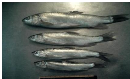
شکل ۱- گونه Schizocypris brucei در تالاب هامون و چاه نیمه زابل

درجه حرارت مطلق آن ۴۹ درجه سانتی‌گراد، حداقل درجه حرارت مطلق ۷-درجه سانتی‌گراد و متوسط درجه حرارت سالانه ۲۴ درجه سانتی‌گراد است و آب‌وهوای بیابانی دارد [۴]. تالاب بین‌المللی هامون که در کنوانسیون رامسر (۱۹۷۱) یکی از تالاب‌های بین‌المللی دنیا قلمداد شده است و به دلایل مختلف اهمیت زیست محیطی خاصی دارد. اگر چه فون جانوری آن غنی نیست و گونه‌های اندکی از ماهیان در آن زیست می‌کنند ولی عدم توجه و مطالعه‌ی این فون امری غیر معقول می‌نماید. به ویژه وجود دو گونه ی نادر بومی از جنس Schizothorax و یک گونه از جنس Schizocypris متعلق به زیرخانواده- Schizothoracinae که فون ماهیان ایران را با آسیای مرکزی و کشورهای چین، هندوستان، پاکستان، افغانستان و... پیوند می‌دهد. تعداد ۹ گونه را از سیستان معرفی کرده اند که بومی این منطقه می‌باشند که حضور ۷ گونه ماهی در منطقه سیستان از خانواده کپور ماهیان که از ۷ گونه ۴ گونه در ایران فقط در سیستان وجود دارند [۱۰]. از آنجائیکه تالاب بین‌المللی هامون که در کنوانسیون رامسر (۱۹۷۱) یکی از تالاب‌های بین‌المللی دنیا قلمداد شده است و به دلایل مختلف اهمیت زیست محیطی خاصی دارد. عمده‌ترین محل زادآوری [۱۰] و تنها زیستگاه این گونه در ایران تالاب هامون و آب‌های چاه نیمه زابل می‌باشد. بررسی رژیم غذایی ماهی انجک در