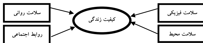
نمودار ۱: عوامل مؤثر بر کیفیت زندگی از دیدگاه سازمان جهانی بهداشت

چابکی، درد و ناراحتی، خواب و استراحت، ظرفیت و توانایی برای کار و فعالیت می‌باشد. ۲- سلامت روانی شامل رضایت و تصور شخص از خود و ظاهر بدنی‌اش، احساسات مثبت و منفی فرد، اعتماد به نفس، اعتقادات روحی، مذهبی، شخصی، تفکر، یادگیری و حافظه و تمرکز می‌باشد. ۳- روابط اجتماعی شامل ارتباطات شخصی، حمایت اجتماعی و فعالیت جنسی می‌باشد. ۴- سلامت محیط شامل منابع مادی و مالی، آزادی، ایمنی، میزان در دسترس بودن و کیفیت مراقبت‌های بهداشتی، درمانی و اجتماعی، فرصت‌های پیش رو برای کسب و به دست آوردن اطلاعات و مهارت‌های جدید، امکان فعالیت‌های تفریحی، سلامت محله‌ای که شخص در آن زندگی می‌کند و امکانات آن و همچنین سلامت محیط خانه می‌باشد (نجات و دیگری، ۱۳۸۵: ۱۱).