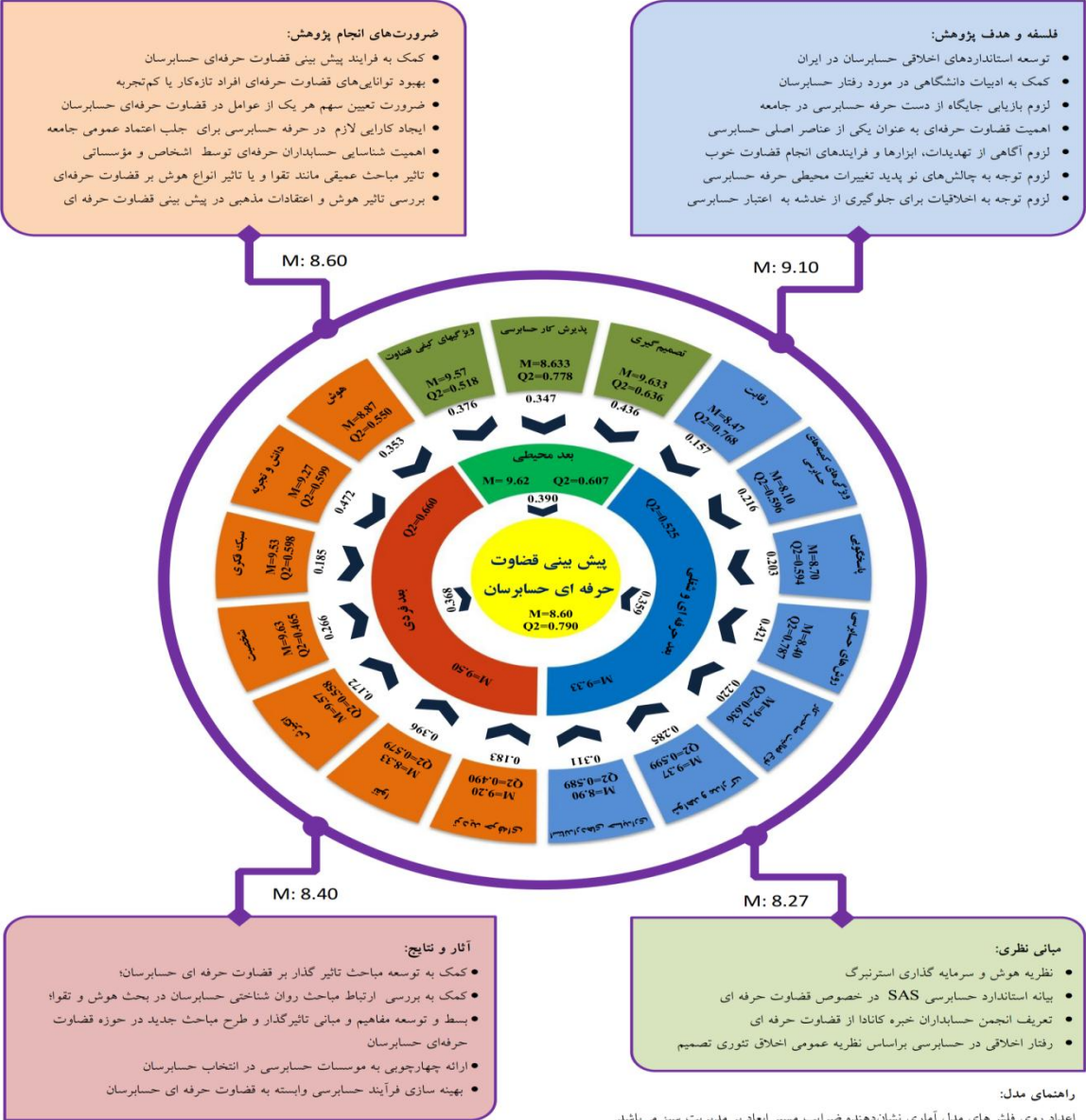
شکل ۳- الگوی پیش‌بینی قضاوت حرفه‌ای حسابرسان