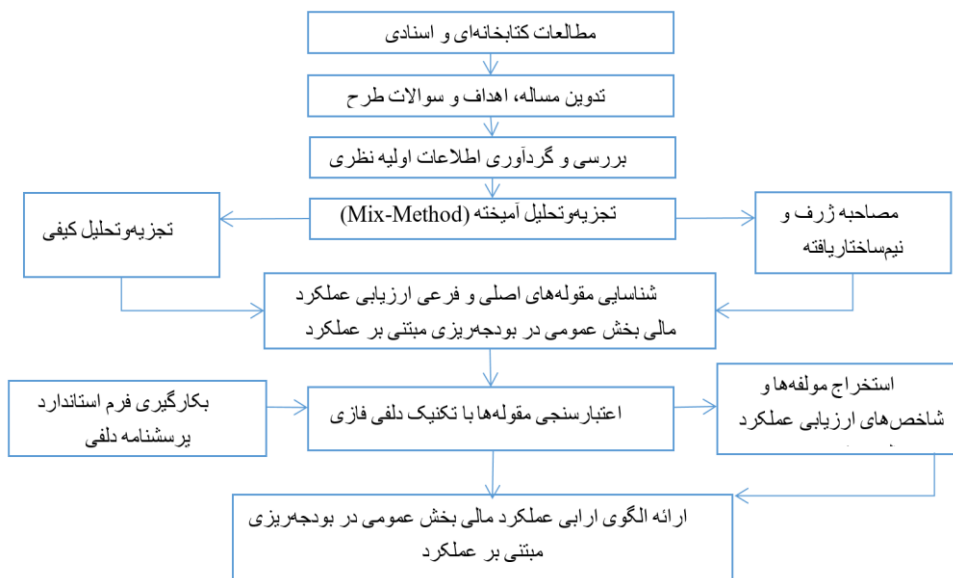
شکل ۱- فلوچارت مراحل طراحی الگو