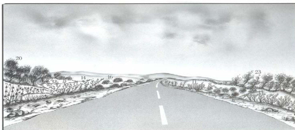
تصویر ۱: به عنوان نمونه طراحی تصویر واحد فیزیوگرافی ۳-۲ مسیر جاده بندرعباس- میناب

به منظور دستیابی به طراحی و ترسیم مناظر و امکان پذیری عملیات اجرایی در مسیر بندرعباس- میناب از یک طرف و انتخاب ترکیب پوشش گیاهی که امکان ایجاد مناظر چشم نواز را میسر سازد، از طرف دیگر، ابتداء اقدام به تهیه تصاویر رنگی از واحدهای فیزیوگرافی و از نقاطی که از نظر موقعیت و وضعیت عمومی با کل واحد تا حدودی مشابهت داشتند، شده است سپس با استفاده از کامپیوتر، تصاویر مذکور اسکن و تصاویر پردازش شده در اندازه یا قطع A4 اخذ گردیدند. تعیین حدود و عوارض تصاویر به دست آمده از طریق انتقال آنها بر روی کاغذ کالک و استفاده از جدول شماره یک برای انتخاب مجموعه های گیاهی مناسب و ترسیم مناظر در چارچوب مقاطع که بتواند دستیابی به اهداف را ممکن سازد مرحله نهایی این بخش از کار می باشد. به عنوان مثال: تصویر زیر مربوط به واحد فیزیوگرافی ۳.۲ جاده بندرعباس- میناب است که پس از اسکن و تبدیل آن به قطع A4 طراحی گردیده است (۲۱).