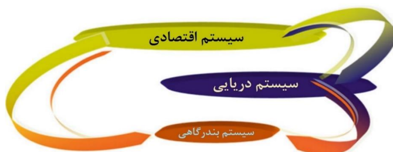
شکل ۳- سیستم بندرگاهی و تعامل آن با سایر سیستم‌های یک جامعه

بندرگاهی اثرگذار هستند. این فشار در قالب پیشبرد شرایط مربوط به زیرساخت‌ها، روبناها ۱ ، تجهیزات، کارآمدی، سازماندهی و غیره می‌باشد (سانچز و ویلمز میر، ۲۰۱۰). این اثرات را به طور ساده می‌توان در شکل زیر نمایش داد: