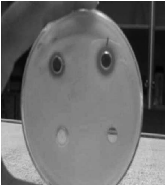
شکل ۳. اثر سوسپانسیون پروبیوتیکی و اسیدهای آلی با pH خنثی در مهار رشد اشریشیا کلی O157:H7: اطراف چاهک های حاوی اسید آلی (دو چاهک پایین) در مقایسه با چاهک حاوی پروبیوتیک (دو چاهک بالا) رشد باکتری ممانعت نشده است.

کلی O157:H7 نمی تواند باشد (۱۵). به همین دلیل در این پژوهش ما نیز اثر آنتاگونیسمی اسیدهای آلی بر رشد باکتری اشریشیا کلی O157:H7 مورد بررسی قرار دادیم. نتایج نشان داد که اسیدهای آلی نمی توانند اثر قابل ملاحظه ای بر علیه این باکتری ایجاد نمایند. به نظر می رسد که عوامل دیگری مانند باکتریوسین ها، تولید و ترشح متابولیت های آلی و گلیکولپیدهایی با فعالیت بیولوژیک قوی در اثر مهار بر علیه این باکتری می تواند نقش تعیین کننده داشته باشد. اثر اسیدهای آلی و باکتریوسین ها و متابولیت های آلی تولید شده توسط پروبیوتیک ها علیه اشریشیا کلی O157:H7 روی رده سلولی ورو نیز بررسی شد و نتایج مشابهی حاصل گردید. متابولیت های آلی تولید شده حتی زمانی که pH محیط خنثی شد مانع تخریب رده سلولی ورو توسط اشریشیا کلی O157:H7 گردید (نتایج در این مقاله ذکر نشده است).