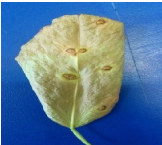
شکل ۱: برگ لیمو ترش آلوده به شانکر باکتریایی مرکبات.

الف) نمونه برداری و جداسازی: این مطالعه به صورت مقطعی بر روی برگ‌های علامت دار درختان لیموترش جمع‌آوری شده از شهرستان جیرفت در استان کرمان در بهمن ماه سال ۱۳۹۱ انجام شد. برگ‌های علامت دار درختان لیموترش آلوده به شانکر باکتریایی بودند (شکل ۱). نمونه‌ها درون پاکت‌های کاغذی قرار داده شدند و به آزمایشگاه دانشگاه تنکابن منتقل گردیدند. با استفاده از تیغ استریل نقاط قهوه‌ای رنگ بافت