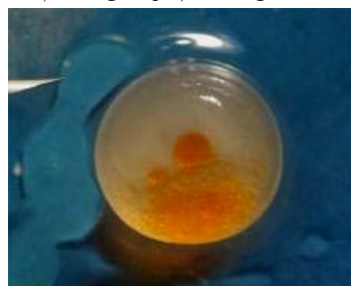
شکل ۳- تخم لقاح نیافته