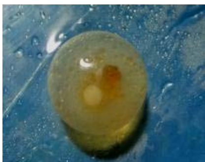
شکل ۲- تخم قبل از تقسیم