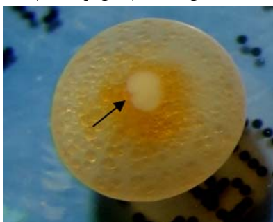
شکل ۴- تخم بعد از تقسیم