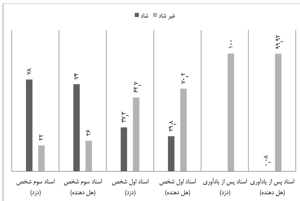
شکل ۱. مقایسه درصد اسنادهای اول شخص، سوم شخص و پس از یادآوری در دو داستان

شکل ۱ مقایسه کلی بین درصد پاسخ افراد به هر سه پرسش و بررسی هر سه اسناد ارائه شده را نشان می دهد.