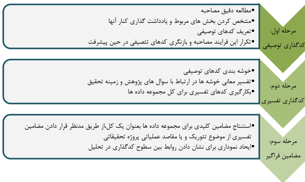
شکل ۱: رویه کدگذاری (کینگ و هاروکز، ۲۰۱۰، ۱۵۳)

پژوهش حاضر از جمله پژوهش‌های آمیخته با هدف کاربردی می‌باشد؛ که براساس ماهیت و هدف اصلی پژوهش از طرح اکتشافی و مدل ایجاد طبقه بندی بهره گرفته شده است. در این پژوهش محقق در مرحله‌ی نخست با استفاده از داده‌های کیفی به دنبال تبیین و واکاوی موانع و چالش‌های انگیزه خدمات عمومی در سازمان‌های دولتی است و در مرحله دوم با بهره‌گیری از روش دلفی و داده‌های کمی به دنبال قضاوت دقیق‌تر پیرامون نتایج مرحله ی اول می‌باشد. جامعه آماری این پژوهش را ۲۱ نفر از خبرگان و