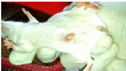
شکل. تومور کارسینومای سینه ER^+ تشکیل شده در ناحیه

به منظورالقاء بیهوشی در حیوانات از ترکیب داروهای زایلازین (شرکت alfasan) با غلظت 10 mg/ml و کتامین (شرکت ROTEXMEDICA) با غلظت 100mg/ml استفاده گردید. برای این منظو ابتدا ترکیبی با نسبت 1:10 (10 میلی لیتر از کتامین + ۱ میلی لیتر از زایلازین) به صورت استوک تهیه گردید و به مقدار 110 mg/kg بر اساس وزن هر حیوان به آنها به صورت داخل صفاقی (IP) تزریق گردید [۱۱].