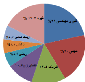
نمودار ۲. درصد پوشش حوزه‌های موضوعی در همکاری علمی دانشگاه تبریز با دانشگاه‌های خارجی

حوزه‌های موضوعی در همکاری دانشگاه تبریز با کشورهای خارجی در نمودار ۲ ارائه شده است. همان‌طور که در نمودار ۲ مشاهده می‌شود حوزه فنی و مهندسی بیشترین همکاری را با ۲۱ درصد به خود اختصاص داده است و حوزه‌های شیمی با ۲۰ درصد، فیزیک با ۱۳/۵ درصد و کشاورزی با ۱۰/۶ درصد رتبه‌های بعدی را در میزان پوشش موضوعی تولیدات علمی به خود اختصاص داده‌اند. به طور کلی همکاری علمی دانشگاه تبریز با مؤسسات و دانشگاه‌های خارجی بیشتر در حوزه‌های فنی مهندسی و علوم پایه است و در حوزه‌های علوم انسانی همکاری کمتری را با آنها دارد.