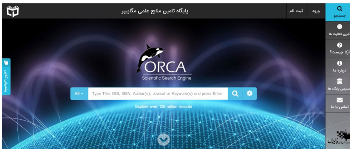
شکل ۳. پایگاه تأمین منابع علمی مگاپیپر

همزمان با شیوع ویروس کرونا در سطح کشور و تعطیلی کتابخانه‌های عمومی و دانشگاهی، دسترسی طیف وسیعی از دانشجویان و پژوهشگران به شبکه‌های اطلاعاتی موجود در کتابخانه‌ها و مراکز اطلاع رسانی قطع شد. در این بخش نیز کتابداران پیشگامی بودند که با راه اندازی صفحات مجازی در اینستاگرام و یا در وبلاگ‌های کتابخانه به طرق مختلف در ارائه مطالب صحیح و معتبر و آگاهی بخشی به اعضا نقش پررنگی را از خود نشان دادند. این خدمت در ادامه با برنامه‌ریزی و پیگیری صورت گرفته در حوزه اداره کل توسعه کتابخانه‌ها به صورت رسمی در بهمن ماه ۱۳۹۹ در کلیه استان‌ها کلید خورد و در این مرحله حداقل ۱۰ کتابخانه از هر استان به پایگاه‌های اطلاعاتی و منابع الکترونیک فارسی و لاتین خریداری شده تحت عنوان پایگاه تأمین منابع علمی مگاپیپر متصل گردیدند و این ۱۰ کتابخانه در فاز اول وظیفه ارائه خدمات مرجع به کلیه اعضا کتابخانه‌های عمومی را بر عهده دارند (شکل شماره ۳)