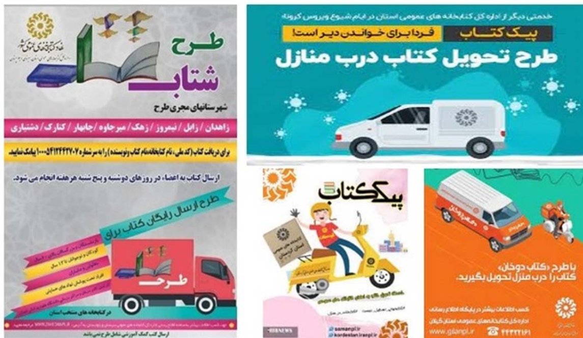
شکل ۲. نمونه از تبلیغات طرح خدمات تحویل کتاب در محل