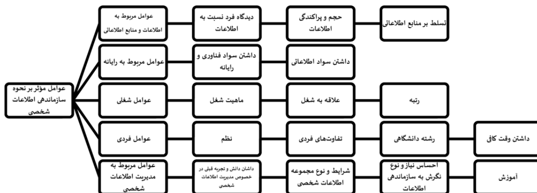
شکل ۲: عوامل مؤثر بر نحوه سازماندهی اطلاعات شخصی توسط اعضای هیئت علمی مورد بررسی

"پوشه های مربوط به کتاب های آن موضوع، مثلاً پوشه های مربوط به پروپوزال، پروپوزال هایی که در تاریخ های مختلف تهیه شده است، من حتی پروپوزال های قبلی را دارم و تاریخ تهیه و