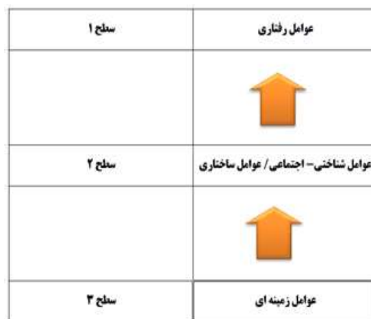
شکل ۱. سطح بندی عوامل موثر بر مدیریت احساسات

برای ترسیم مدل، با توجه به سطوح عوامل و ماتریس دسترسی نهایی و از طریق حذف روابط ثانویه، مدل نهایی بدست می‌آید که این شکل در مدل‌سازی ساختاری تفسیری، مدل ساختاری نامیده می‌شود. مدل سطح بندی عوامل در شکل ۱ نمایش داده شده‌است.