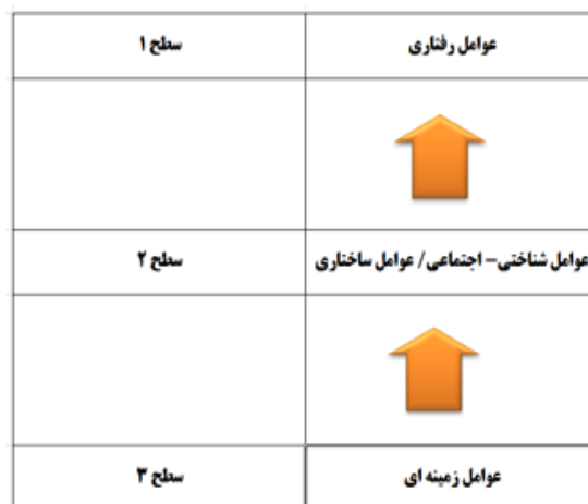
شکل ۱. سطح بندی عوامل موثر بر مدیریت احساسات

برای ترسیم مدل، با توجه به سطوح عوامل و ماتریس دسترسی نهایی و از طریق حذف روابط ثانویه، مدل نهایی بدست می آید که این شکل در مدل سازی ساختاری تفسیری، مدل ساختاری نامیده می شود. مدل سطح بندی عوامل در شکل ۱ نمایش داده شده است.