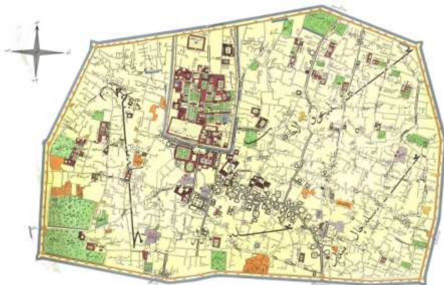
نقشه ۱ محدوده بازار تهران