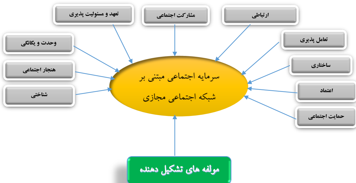
۱. شکل ۱-مدل مفهومی اولیه برگرفته از مبانی نظری و پیشینه تحقیق

بعد از جمع بندی های صورت گرفته ،مولفه های پیشنهادی در قالب چارچوب نظری شامل تعهد و مسئولیت پذیری ۱ ، تعامل پذیری ۲ ، اعتماد ۳ ، مشارکت اجتماعی ۴ ، وحدت و یگانگی ۵ ، حمایت اجتماعی ۶ ، هنجار اجتماعی ۷ ، ساختاری ۸ ، ارتباطی ۹ ، شناختی ۱۰ می باشد. بنابراین با توجه به موضوعات مطرح شده در بیان مساله و پیشینه تحقیقات مدل مفهومی تحقیق به شرح زیر می باشد: