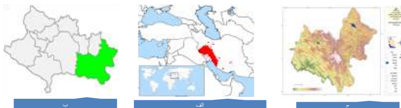
شکل ۲: الف) پراکندگی جمعیتی قوم بختیاری (ب) موقعیت مکانی شهرستان الیگودرز در استان لرستان (ج) نقشه شهرستان الیگودرز

جامعه مورد مطالعه شده شهرستان الیگودرز است این شهرستان با مساحتی ۵۰۰۰ کیلومتر مربع در شرق استان لرستان واقع شده است. جمعیت این شهرستان ۱۳۷،۵۳۴ هزار نفر است (آمار ایران، ۱۳۹۵: ۱۲) و مردم این شهرستان به زبان لری بختیاری تکلم می‌کنند.