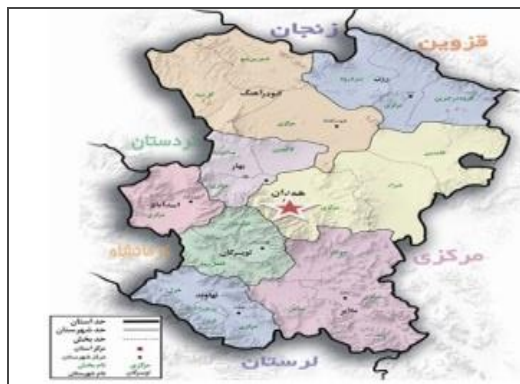
شکل ۱. موقعیت استقرار شهر همدان در استان

مدارک باستان شناختی و همچنین شواهد مکتوب ثابت می‌کند که همدان در طول دوران باستان نقش کلیدی ایفا می‌کرده است، زیرا در شمال ایران هیچ جایی جز هکمتانه وجود ندارد که اهمیت آن به کرات در متون یونانی و رومی از آن یاد شده باشد (کیانی، ۱۳۷۴: ۲). نخستین شهر مادها به عنوان محل تجمع و مظهر یگانگی آنان با ایجاد اولین دولت مستقل در ایران به نام سلسله ماد به عنوان یک پایتخت و مرکز حکومتی، پاسخی برای نیاز به داشتن یک دولت مستقل بود (مشهدی‌زاده دهاقانی، ۱۳۷۸: ۵). استان همدان با مساحت ۱۹۴۹۳ کیلومتر مربع، ۱/۲ درصد از کل مساحت کشور را در بر می‌گیرد. این استان بین مدارهای ۳۳ درجه و ۵۹ دقیقه تا ۳۵ درجه و ۴۹ دقیقه عرض شمالی و ۴۷ درجه و ۳۴ دقیقه تا ۴۹ درجه و ۳۶ دقیقه طول شرقی از نصف النهار گرینویچ قرار گرفته است. استان همدان جزء استان‌های غربی ایران است که از شمال به استان زنجان، از جنوب به استان لرستان از شرق به استان مرکزی و از غرب به استان‌های کرمانشاه و کردستان محدود می‌شود. بلندترین نقطه استان همدان، قله الوند با ارتفاع ۳۵۷۴ متر، بین شهرستان‌های تویسرکان و همدان قرار گرفته و پست ترین مکان این استان اراضی عمرآباد در کنار رود قره چای در بخش شراء است. استان همدان براساس آخرین تقسیمات کشوری و سرشماری سال ۱۳۸۵ و اصلاحات بعدی شامل: ۹ شهرستان، ۲۷ شهر، ۲۳ بخش، ۷۱ دهستان، ۱۱۲۰ روستا است و مرکز این استان شهر همدان است.