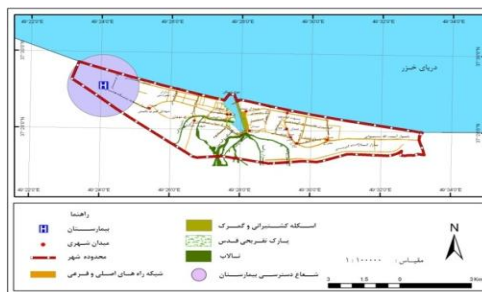
شکل ۲. شعاع دسترسی بیمارستان شهر انزلی

شعاع دسترسی استاندار بیمارستان ۱ تا ۱/۵ کیلومتر و درمانگاه‌ها ۶۵۰ تا ۷۵۰ متر می‌باشد. شعاع دسترسی مراکز بهداشت و پایگاه‌های بهداشتی بر اساس جمعیت مشخص می‌شود، انزلی با داشتن یک بیمارستان علاوه بر جمعیت کل شهرستان جمعیت رضوانشهر را تحت پوشش قرار می‌دهد. بنابراین همه شهروندان نمی‌توانند از شعاع استاندارد ۱ تا ۱/۵ کیلومتر برخوردار باشند، همان‌طور که در شکل (۲) مشاهده می‌شود ساکنین بخش شرقی، مرکزی، شمال و جنوب شرقی حتی قسمتی از بخش غربی شهر باید بیشتر از ۱/۵ کیلومتر طی کنند تا به بیمارستان برسند، از این رو با توجه به کل جمعیت تحت پوشش، حداقل باید بیمارستان انزلی را از لحاظ تجهیزات پزشکی و پزشکان متخصص تقویت نمود تا بتواند جمعیت مذکور را به خوبی سرویس دهد. درمانگاه‌های شهر همان‌طور که گفته شد در بخش شرقی و مرکزی شهر مستقر بوده از این رو تا شعاع ۷۵۰ متر اطراف خود را به راحتی پوشش می‌دهد، همان‌طور که در شکل (۳) می‌بینیم فقط دو درمانگاه رازی و فاطیما همدیگر را پوشش می‌دهند.