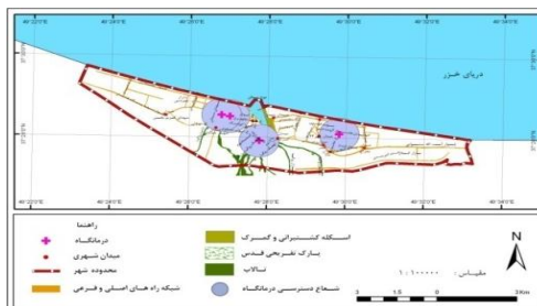
شکل ۳. شعاع دسترسی درمانگاه‌های شهر انزلی