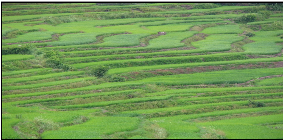
تصویر ۵: نمایی زیبا از شالیزار در حاشیه‌ی جاده‌ی ارتباطی در روستا