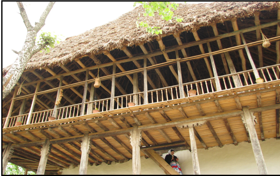
تصویر ۶: معماری سنتی مسکن روستایی شهرستان لنگرود

فراهم آورده است. کشاورزی این ناحیه علاوه بر جنبه های اقتصادی که برای گذران معیشت جوامع انسانی مهم می باشد، همراه خود بار فرهنگی - اجتماعی فراوانی دارد که طی سالیان دراز نسل به نسل در زندگی مردمان ناحیه آمیختگی پیچیده ای دارد. اکنون که متنوع سازی فعالیت های کشاورزی در اکثر کشورهای پیشتاز صنعت توریسم به سرعت رو به جلو می تازد و رواج شاخه ی جدید گردشگری با عنوان گردشگری کشاورزی سهم عمده ای در درآمد روستاییان دارد، زمان آن فرا رسیده است که در کشور ما هرکجا که امکان سرمایه گذاری در این زمینه وجود دارد به مرحله اجرا گذاشته شود و طبق بررسی های صورت گرفته ، شهرستان لنگرود از شرایط مناسبی در این زمینه برخوردار می باشد و می توان همراه با عرصه ی جهانی در این زمینه ی گام های موثری برداشت. تصویر(۶). شکل(۲) نقشه انواع گونه های گردشگری روستایی شهرستان لنگرود را نشان می دهد.