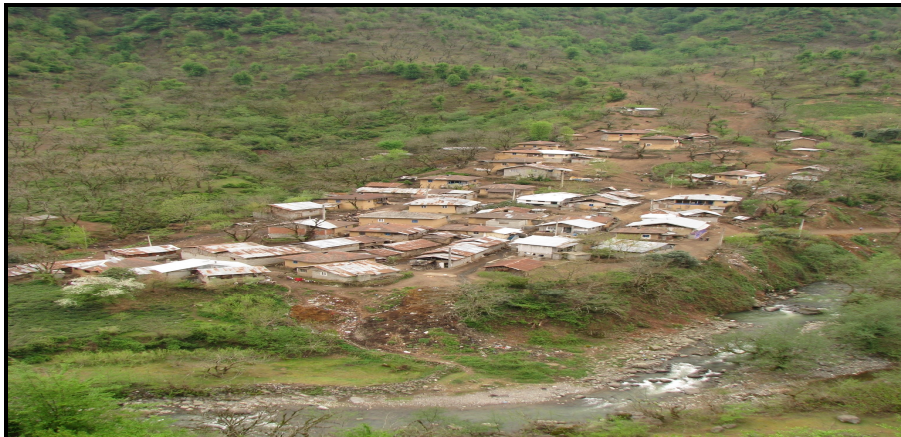
تصویر ۲: یکی از روستاهای جنگلی در حاشیه رودخانه در دهستان لاتلیل

در ضمن از آنجایی که برخی روستاهای محدوده که اقتصاد آنها متکی به دام بوده و شامل طرح خروج دام از جنگل شده‌اند، این خدمات رسانی را بیشتر با مشکل مواجه ساخته است که به طور کلی یکی از راه‌های آن توسعه گردشگری در محدوده برای کاهش آسیب رسانی به جنگل و بهبود وضعیت خدمات رسانی را ایجاد می‌کند ضمن اینکه می‌تواند علاوه بر بهره‌وری بهتر از امکانات محیطی منطقه از مهاجرت و سردرگمی روستاییان در نقاط شهری جلوگیری به عمل آورد. تصاویر (۳ و ۲).