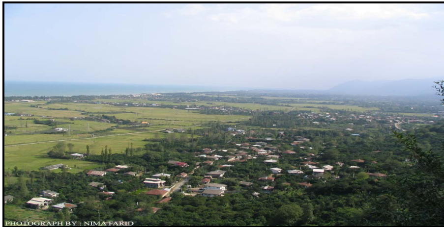
تصویر ۱: چشم اندازی زیبا از روستاهای ساحلی شهرستان لنگرود

ی بخش ها از مزایای گردشگری بهره مند می شوند. این نوع از گردشگری مهمترین اثرات محیطی که در حاشیه دریا داشته، شامل ویلاسازیهایی است که در ساحل صورت گرفته و یک نوار خانه های دوم را در کنار دریا ایجاد کرده است به طوریکه بافت کاملاً متفاوت و متمایزی نسبت به فضای روستا دارد، اگرچه در فاصله حداکثر ۲۰۰ متری از آن واقع شده است. تصویر(۱).