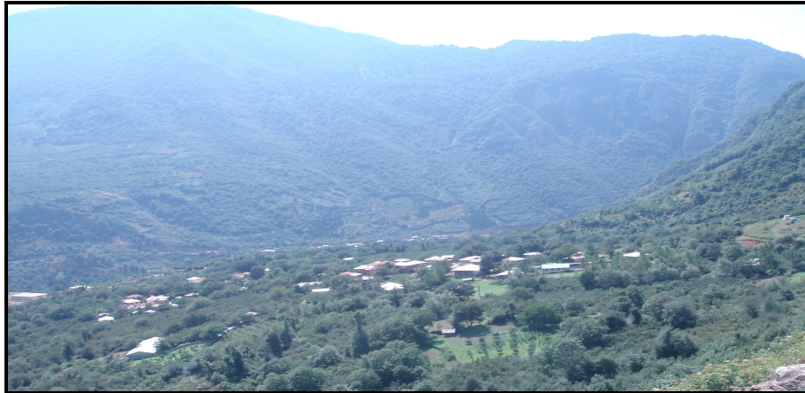
تصویر ۳: نمایی از روستاهای جنگلی در جنوب شهرستان لنگرود