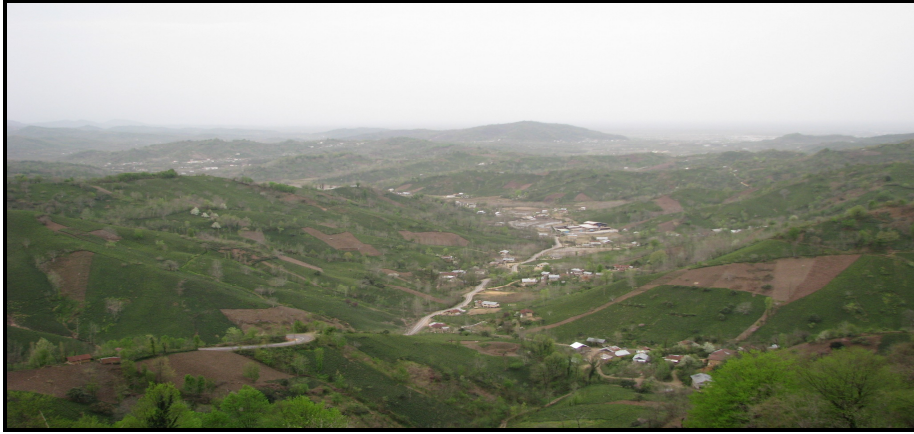
تصویر ۴: چشم اندازی از باغات چای در پیرامون روستایی در دهستان دیوشل