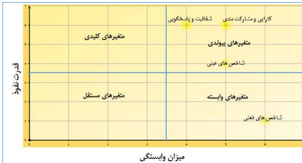
شکل ۵. نمودار سطح بندی عوامل مؤثر بر مشارکت شهروندان در امور شهری با استفاده از روش MICMAC

با توجه به جدول (۷) و نظر کارشناسان امور شهری شاخص‌های شفافیت و پاسخگویی از بیشترین قدرت نفوذ و کمترین وابستگی بین شاخص‌های دیگر برخوردار است که این عامل تایید می‌کند که این دو شاخص نسبت به سایر شاخص‌ها از تأثیرگذاری بالاتری برخوردار هستند.