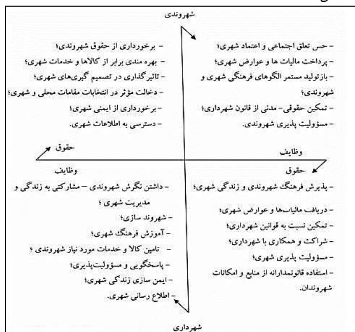
شکل ۲. رابطه شهروندی و شهرداری (مدیریت شهری)، حقوق و وظایف متقابل آن‌ها

و مدیریت شهری به مطالبات مردم در قالب نهادهای مردمی پاسخ می‌دهد (رحیم‌زاده سیسی‌بیگ و همکاران، ۱۴۰۱: ۲۴۴). از جمله پیامدهای مثبتی که تقویت، قانونمند و عقلانی نمودن رابطه شهروندان- شهرداری‌ها، می‌توان به این موارد اشاره کرد: بسط توانایی‌های شهروندان؛ تقویت حس تعلق اجتماعی شهروندان به شهر و زندگی شهری؛ تقویت حس اعتماد اجتماعی شهروندان به نظام مدیریت شهری و شهرداری؛ تقویت حس همکاری میان شهروندان و شهرداری و مدیران شهری؛ تقویت سازوکارهای دموکراسی شهری از طریق تحقق وظایف، حقوق شهروندی و شهرداری. در شکل (۲) ساز و کار رابطه شهروندی و شهرداری، حقوق و وظایف متقابل آن‌ها نشان داده شده است.