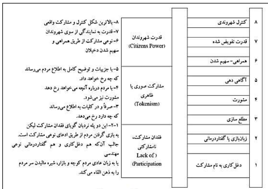
شکل ۱. نردبان مشارکت شری ارنشتین (منبع: نیک پیما و زارعی، ۱۳۹۸:۳۷۹)

طی سال‌های اخیر نظریات مختلفی در باب مدیریت شهری و جایگاه مردم در نظام مدیریتی و چگونگی برخورد با مسائل و مشکلات پیشرو به خصوص در کلان‌شهرها ارایه شده است. در این خصوص نظریه "نردبان مشارکتی" ارنشتین و "گردونه مشارکت" دیوید سون جزء مهم‌ترین نظریاتی هستند که مساله ضرورت مشارکت در شهرسازی و مدیریت شهری را مطرح کردند. در این نظریات بنیادی‌ترین اندیشه زیرساختی مشارکت، پذیرش اصل برابری در فرصت‌ها برای مردم است. همچنین منشأ فرآیند برنامه‌ریزی مشارکتی در چارچوب تقویت حاکمیت محلی در گروه‌های مختلف مشارکت با دیگر گروه‌های ذینفع و ذی‌نفوذ است (Li et al., 2021:2).