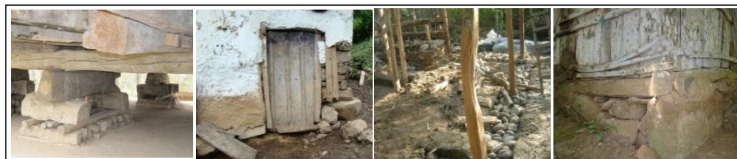
شکل ۲. انواع پی از راست: پی سنگی، پی اسکت چاه، پی سنگ زیر سری، پی شیکیلی