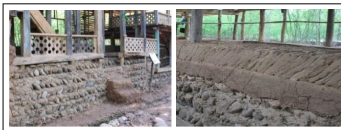
شکل ۳. نمونه کرسی چینی سنگی با ملات

- کرسی: عمدتاً با استفاده از سنگ و کاهگل می‌باشد که به شیوه‌های بومی اجرا شده و اتصال به صورت خشک و با ملات کاهگل امکان واسازی اجزا را به راحتی فراهم می‌نماید. در شکل (۳) نمونه کرسی چینی نشان داده شده است.