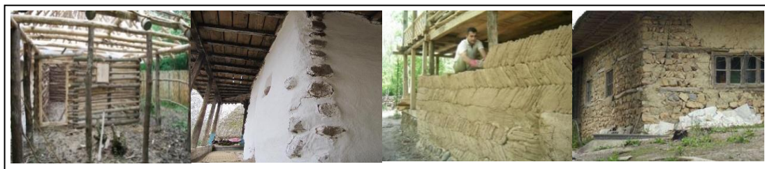
شکل ۱۰. انواع دیوار از راست به چپ: دیوار سنگی، دیوار خشتی، دیوار زگم‌ای، دیوار زگالی