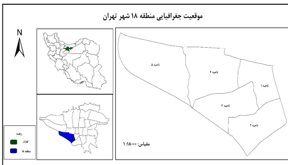
شکل ۱. موقعیت جغرافیایی منطقه ۱۸