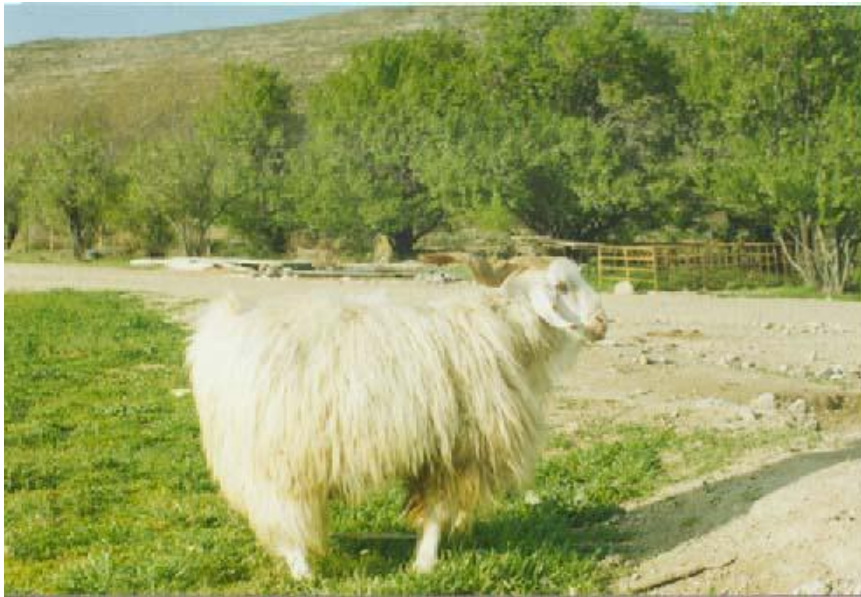
شکل ۱. بز نر، نژاد رائینی