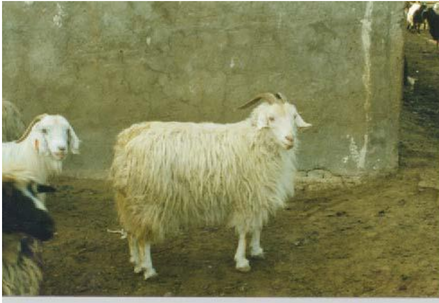
شکل ۳. بز ماده، نژاد رائینی