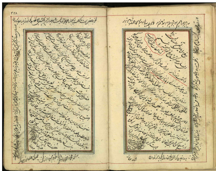
صفحه نخستین از نسخه خطی ۳۵۲۷

افزون بر مطالب عنوان شده، مضامین اندرزی فراوانی را می‌توان در این اندرزنامه یافت که غالباً به صورت جملات کوتاه و حکیمانه بیان شده است و حاصل تجربه شخصی مؤلف است. «ای فرزند آنچه گفتم و شنیدی، به حسب تجربه و عقل خویش بود و بر طبق احوال و روزگار خود و در هر عصری، چیزی مطلوب است و هر زمانی سلوکی مرغوب؛ این سرمشقی است. باید شخص خود صاحب فطانت باشد و در مجالس تجربه گفتار و رفتار فرماید و هر که را از بخشایش خداوند یکتا، دلیل عقل راهنما و توفیق رفیق آمد، احتیاج به شنیدن پند کسانش نیست؛ خود عالمی را پند دهد اما چنین شخصی نادر افتد» (بسمل شیرازی، ۱۳۴۸: ۵۲۳).