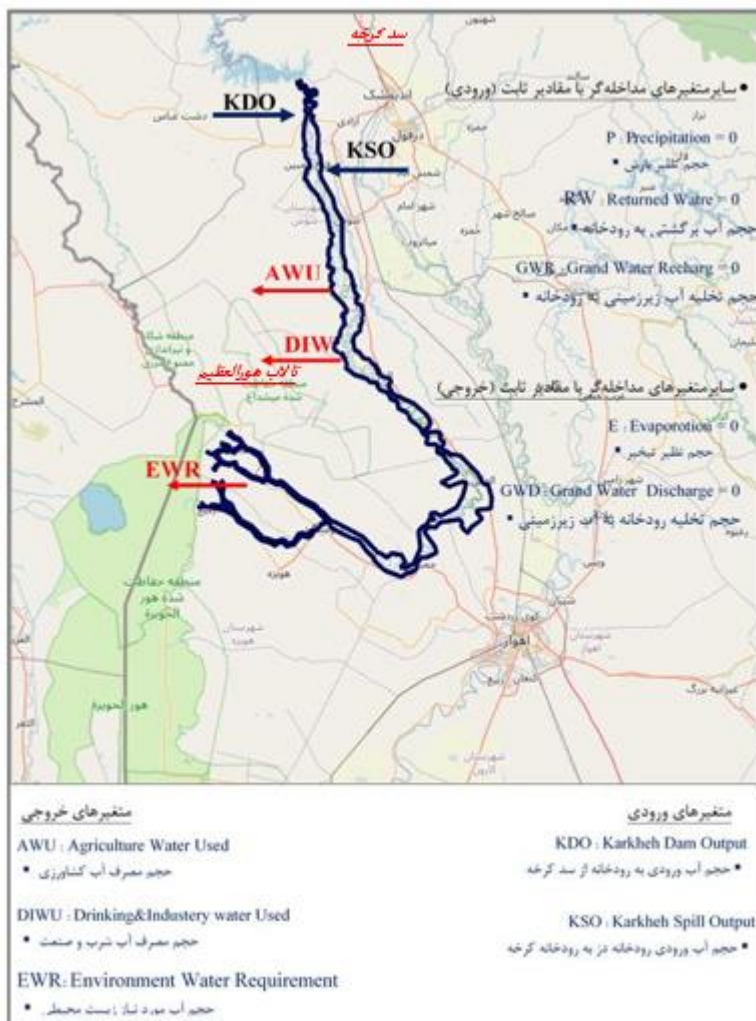
شکل ۳. مدل مفهومی پژوهش بیلان رودخانه کرخه جنوبی

خروجی‌ها نیز از رابطه (۴) محاسبه می‌شوند که شامل: