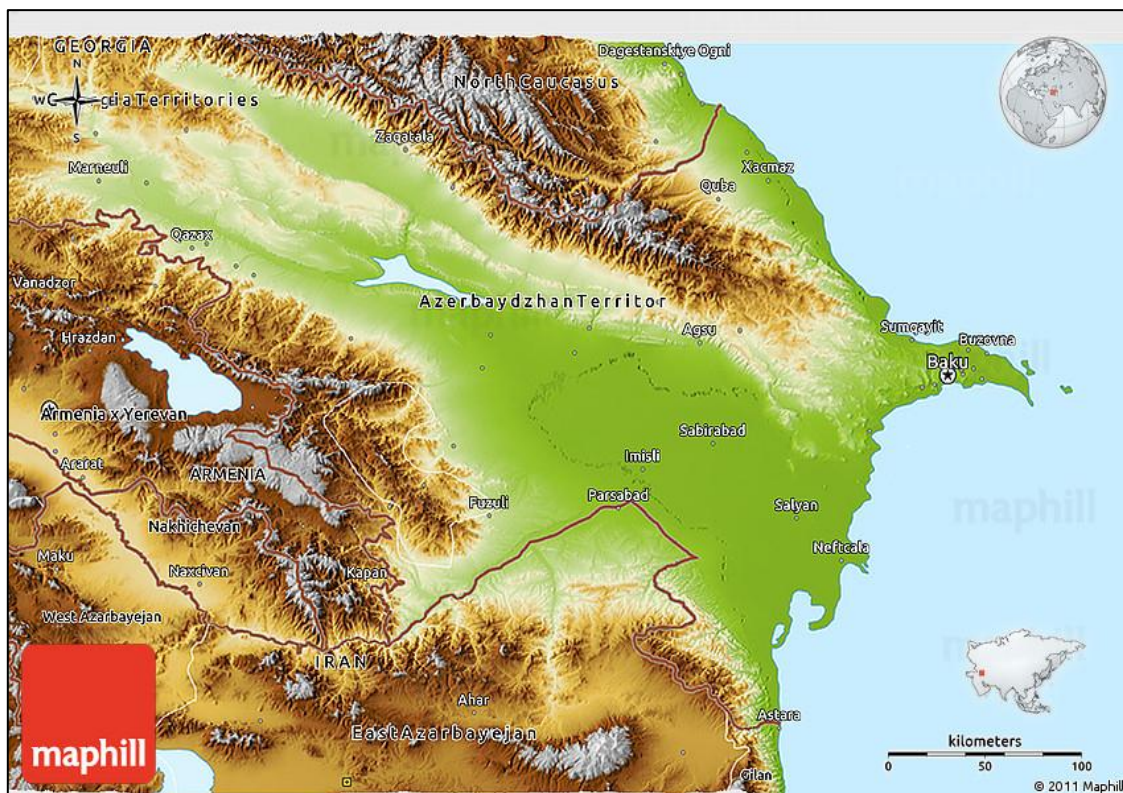
نقشه شماره ۵- موقعیت مرزی آستارا در مجاورت کشور آذربایجان

گیلان از نظر زمینی و دریایی هم‌مرز با کشور آذربایجان می‌باشد و با توجه به تحرکات قدرت‌های فرا منطقه‌ای در این کشور که می‌تواند منافع ملی جمهوری اسلامی ایران را با تهدید مواجه سازد؛ بنابراین تحلیل نقش آمایش سرزمین در توسعه و امنیت مرزی آستارا دارای اهمیت ویژه‌ای است. در این میان عواملی چون دوری از مرکز و انزوای جغرافیایی، تبادلات مرزی، تفاوت‌های فرهنگی و تهدیدات خارجی از عوامل مؤثر بر آمایش این منطقه شناخته شده‌اند (Ezzati & Hasani, 2014: 191).