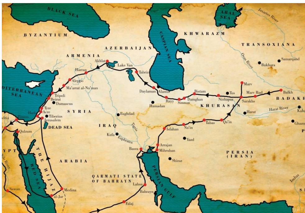
شکل ۲: شهرهای گذر شده توسط ناصر خسرو (سفرنامه ناصر خسرو، جعفر مدرس صادقی)