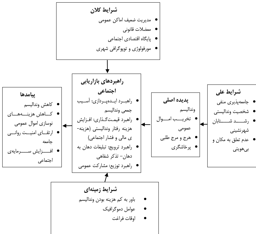
نمودار ۲- مدل کاربرد بازاریابی اجتماعی در پیشگیری از رفتارهای وندالیسم