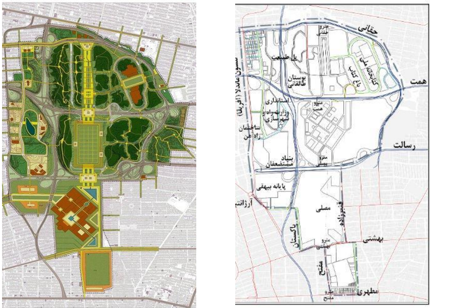
شکل ۲- موقعیت استقرار اراضی عباس آباد