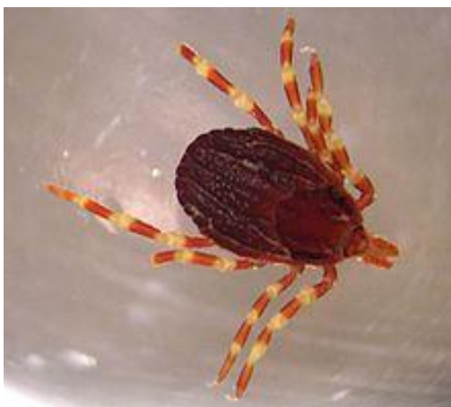
شکل ۱. کهنه هیالوما مارژیناتوم Hyalomma marginatum

دیلدرین در مناطق مختلف کشور می باشد ( Enayati et al., 2010; Enayati et al., 2009; Eshghi et al., 2005). لذا مطالعات میزان حساسیت و یا مقاومت احتمالی در برابر سموم و ترکیبات گیاهی جایگزین به منظور جلوگیری از مقاومت سموم در کهنه ها ضروری به نظر می رسد (Bagavan et al., 2009). بنابراین در این مطالعه سعی گردیده است اثر ضد کهنه ای ۶ عصاره گیاهی شامل زرین گیاه ( Dracocephalam multicaule ), گل مینای صخره زی ( Tanacetum polycephalum ), گل راعی دیهیمی ( Hypericum scabrum ), صمغ آنقوزه ( Ferula assa-foetida ), باریجه ( ferula gummosa ) و ارس ( Juniperus excelsa ) با ضدانگل شیمیایی سایپرمترین مورد مقایسه قرار گرفتند.