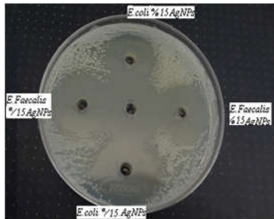
شکل ۳- فعالیت ضد باکتریایی نانو کامپوزیت در غلظت های مختلف از نیترات نقره در روش انتشار دیواره.