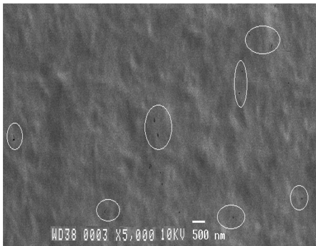
شکل ۲- تصویر میکروسکوپ الکترونی از فیلم نانو بایو کامپوزیت نقره/کیتوسان (0.15 mol/L نیترات نقره).

کوچک دیده می‌شوند. پستی و بلندی‌های ریز مشاهده شده در سطح فیلم مورد مطالعه با SEM مربوط به زبری سطحی فیلم می‌باشد که در تمامی فیلم‌های کیتوسانی قابل مشاهده است. هم‌چنین نانو ذرات به طور یکنواخت در ماتریس پلی‌مر توزیع شده است.