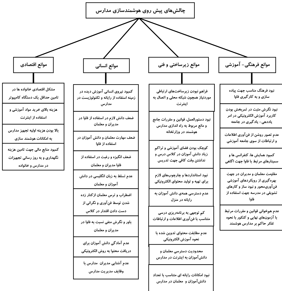
نمودار ۱. مدل مفهومی چالش‌های پیش روی هوشمندسازی مدارس